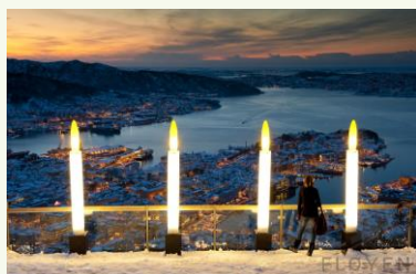
Tatt fra Fløyen

Skikken med å tenne adventslys er ca. 100 år gammel. Det sies at denne også ble brakt fra Tyskland, i likhet med både kalender og juletre. Adventslysene skal være lilla i tråd med kirkeårets adventsfarge (eller den Liturgiske fargen).