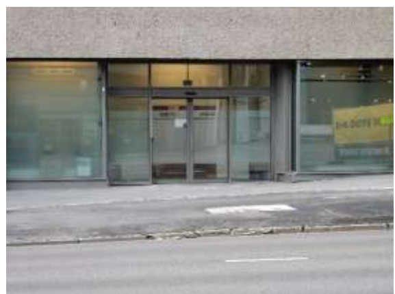
Inngangspartiet vil bli bedre merket etter hvert....