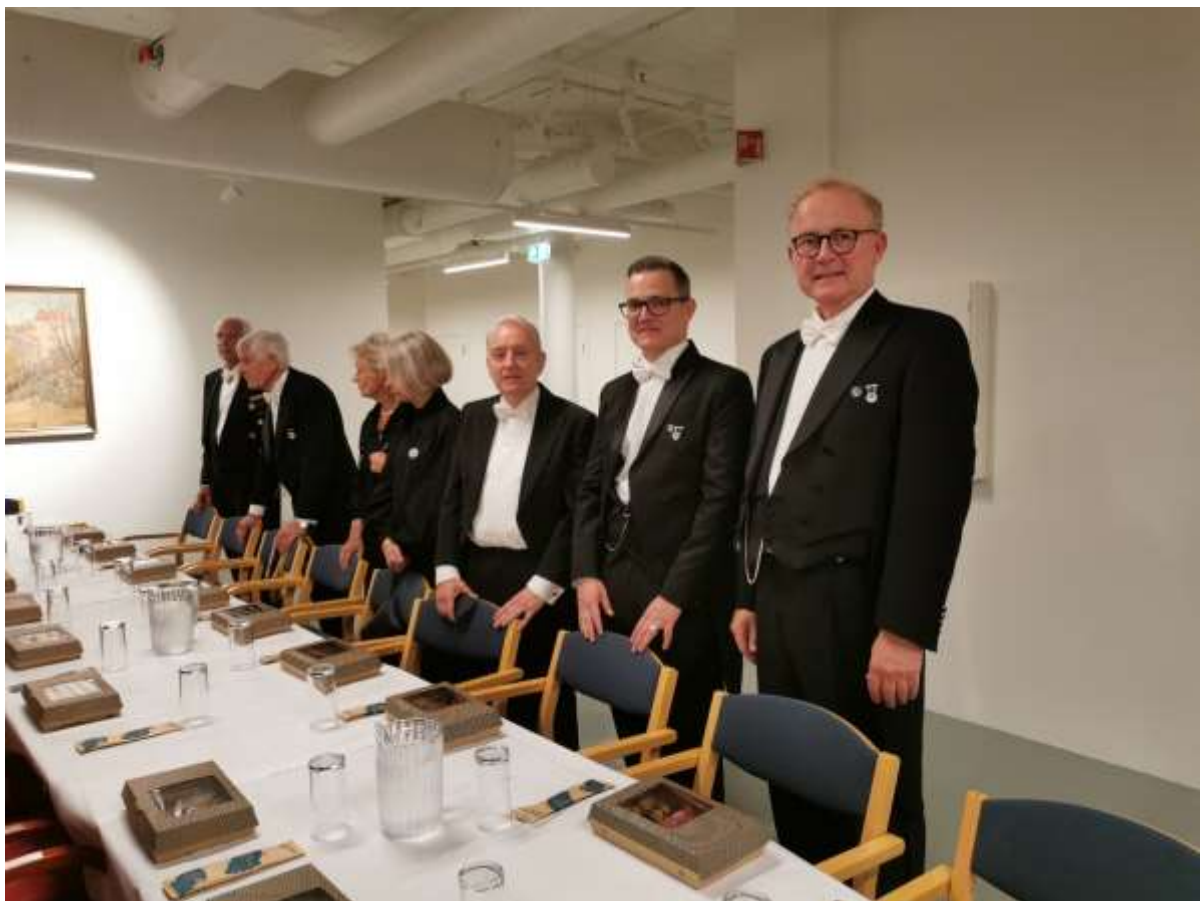
Bilde fra ettermøtet.