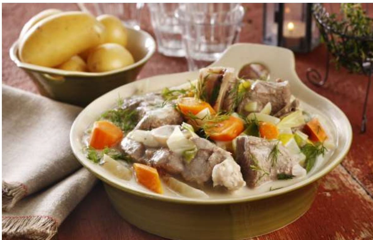
Bilde og oppskrift er gjengitt med tillatelse fra Matprat.no. Foto: Mari Svenningsen.

Høsten er en flott årstid som gir inspirasjon til gode matopplevelser. Denne gangen vil jeg trekke frem en god og gammel rett som de fleste med noen år på baken kjenner igjen – Mors Lammefrikassé. Nå på høsten sankes sauene ned fra fjellbeite, (de slutter derfor å ripe opp lakken på bilen min med bjeller og gps), butikkene bugner av godt fårekjøtt, og, jeg får en smule revansj ved å spise opp den mulige synder. Gled deg til en god høstgryte.