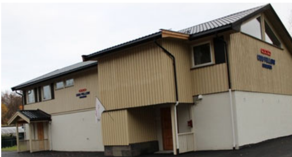
Logehuset i Bamble tilhørende 145 Høgenhei og Rebekkaloge 103 Konvall