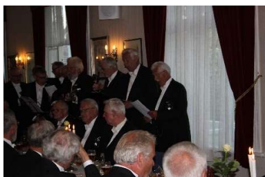
Østre Gab, fra loge 107 Torungen underholder med sang