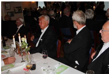
Flere brødre i spisesalen ved taffelet