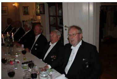
Og enda flere brødre fra taffelet i spisesalen