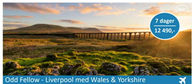
Odd Fellow - Liverpool med Wales & Yorkshire

Turen ble avlyst på grunn av lav påmelding. Kanskje en «mindre» tur er mer aktuell. Vi ønsker turkommiteen lykke til med videre arbeid.