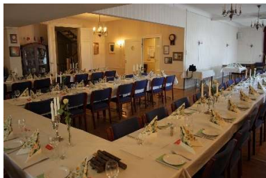
Festdekket bord, til bort imot 90 gjester,