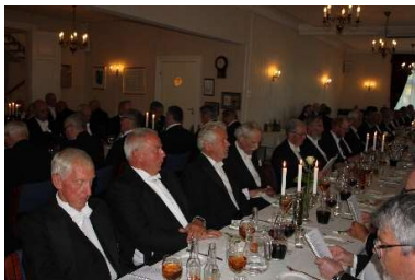
Feststemte brødre ved taffelet i spisesalen