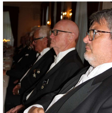
Også fra hovedbordet under taffelet