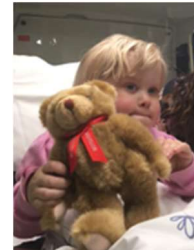
Ei jente koser med bamsen Oddbjørn

Leiren fikk prosjektet «Bamsen Oddbjørn» kastet over seg og vår andel var satt til kr.5.200. En god Patriark foreslo straks at vi burde avholde bingo for å finansiere dette. Bingo ble holdt og i løpet av en liten halvtime, mens vi enda satt ved spisebordet, var det 5.450 netto i kassa. Vår leir anser seg med dette som ferdig med oppgaven. Logene får overta prosjektet. Det er der det hører hjemme.