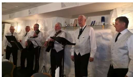
27. april var vi så heldige å bli underholdt av shantykoret Østre Gab! Koret er fra Odd Fellow Loge 107 Torungen i Arendal