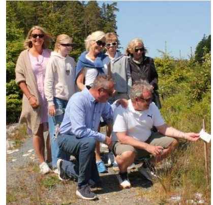
Overmester lurer på om Norge bruker dobbelt så mye toalett-papir som resten av Europa!

sommervær deltok mer eller alle i natursti, blikkbokskasting, styteløp, ringspill og pølsespising. Store og små koste seg og dette er et fint tiltak for å samle logebrødre og deres familier.