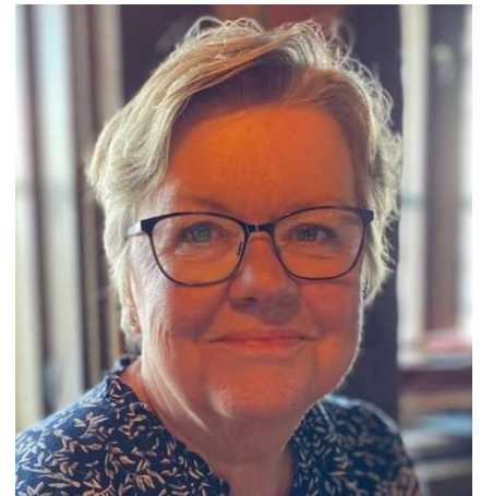
OM i 116 Navigare 2023-2025 er str