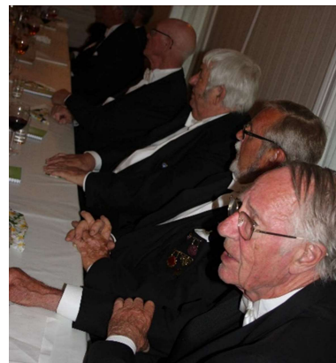
Fra hovedbordet under taffelet i spisesalen