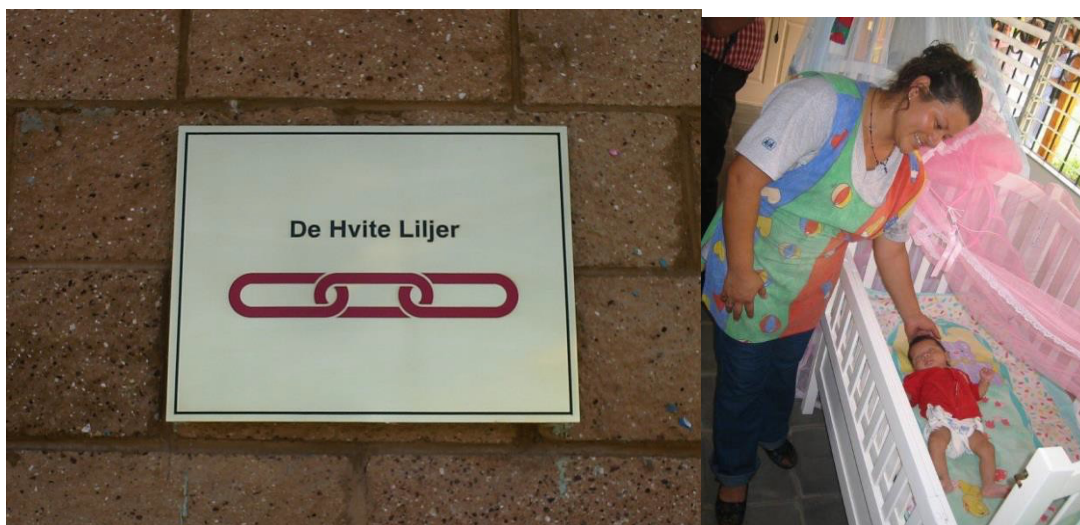
Fra «huset vårt» De Hvite Liljer i El Salvador

Huset som bærer De Hvite Liljers navn, har tjent som sosialsenter og barnehage for de aller minste både fra barnebyen og fra samfunnet rundt.