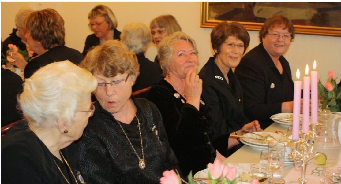
Rebekkaloge nr. 7 De Hvite Liljer på besøk hos søsterloge nr. 40 Ingeborg Spager

Fortsatt møtes logene annet hvert år, henholdsvis i Hjørring og Kristiansand. Det pleier å være godt fremmøte på disse besøkene som har medført at medlemmene blir kjent og har fått et godt fellesskap. I forbindelse med besøkene blir det avholdt logemøter med innvielse eller gradspasseringer.