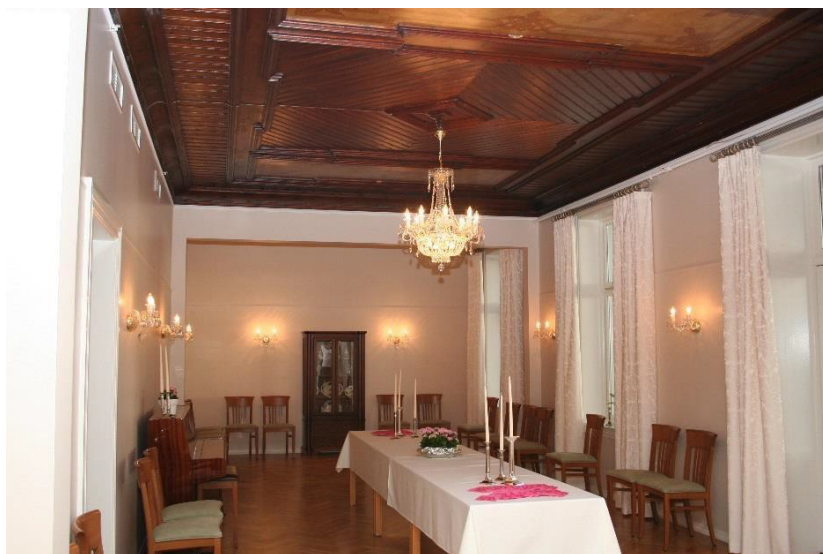
Spisesalen i Festningsgata 2 etter ombygging med en av lysekronene og lampettene som ble gitt i gave av ‘