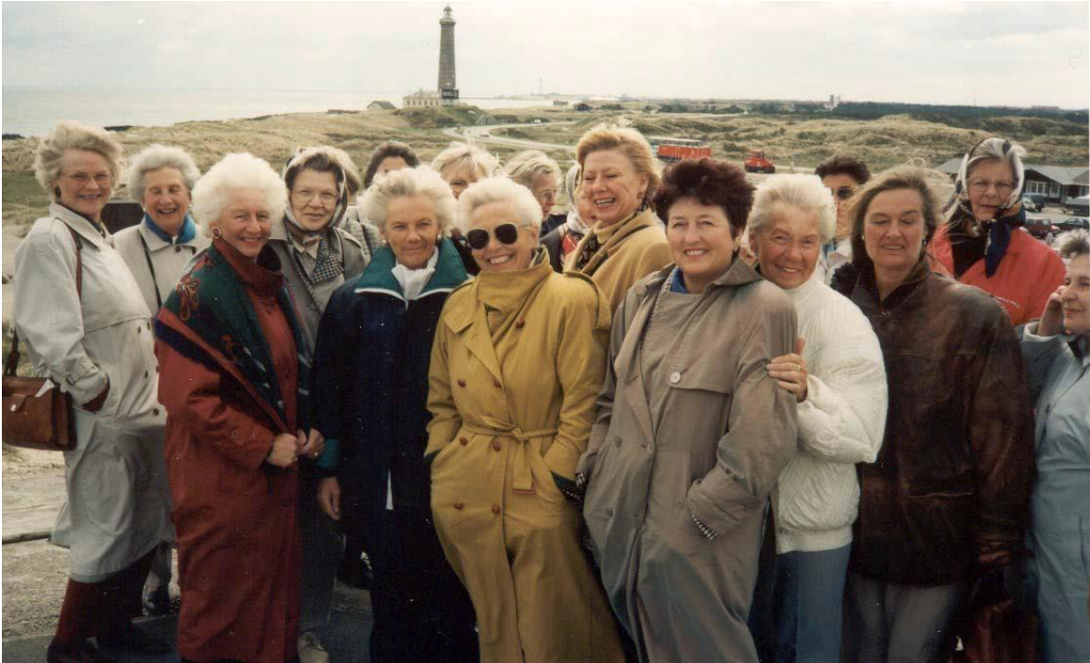
Rebekkaloge nr. 7 De Hvite Liljer i «vinden» på tur til Danmark i 1995

Logens nevnd for styrkelse og ekspansjon har ved flere anledninger arrangert turer for å styrke fellesskapet blant søstrene. Dette er populære tiltak som har fått gode tilbakemeldinger fra søstrene.