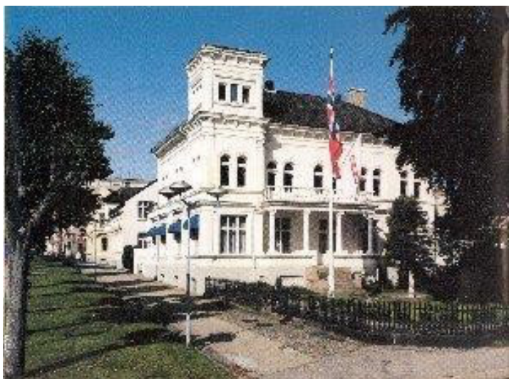
Festningsgata 2, Kristiansand