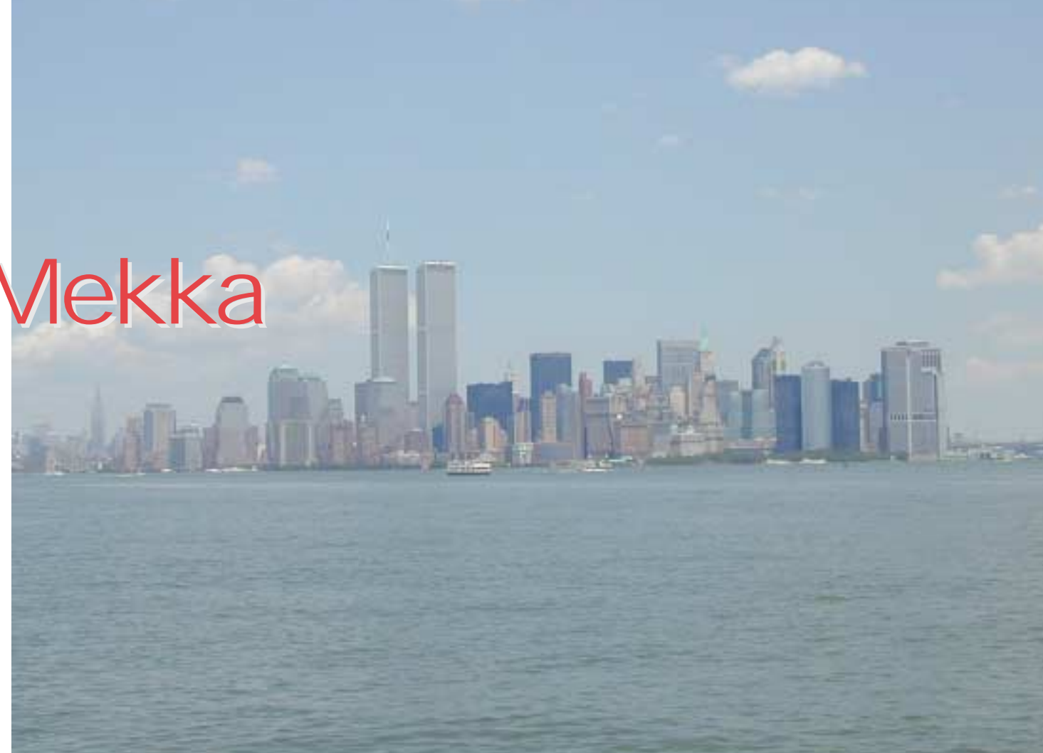
New York, New York... en liten bit av eplet i alle fall.

Befinner du deg på Broadway er sjansen stor for å oppleve Times Square. En gate eller et kryss som er neonsert i all sin prakt. Med bygninger som lyser opp reklame i hele vegger. Der finner du blant annet den velkjente