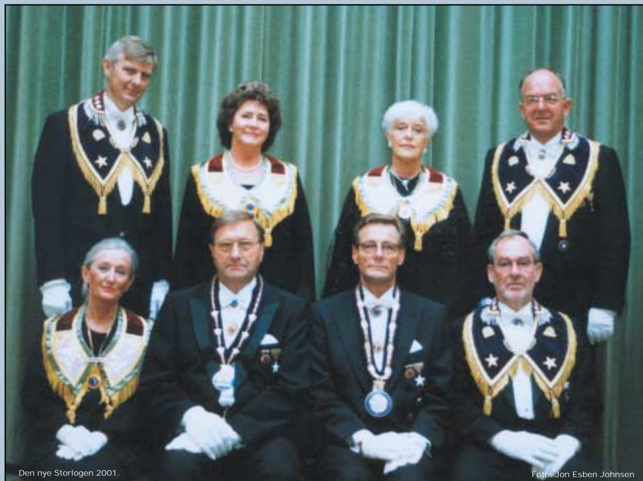
Den nye Storlogen 2001.

Organ for Den Uavhengige Norske Storloge I.O.O.F. 79. årgang