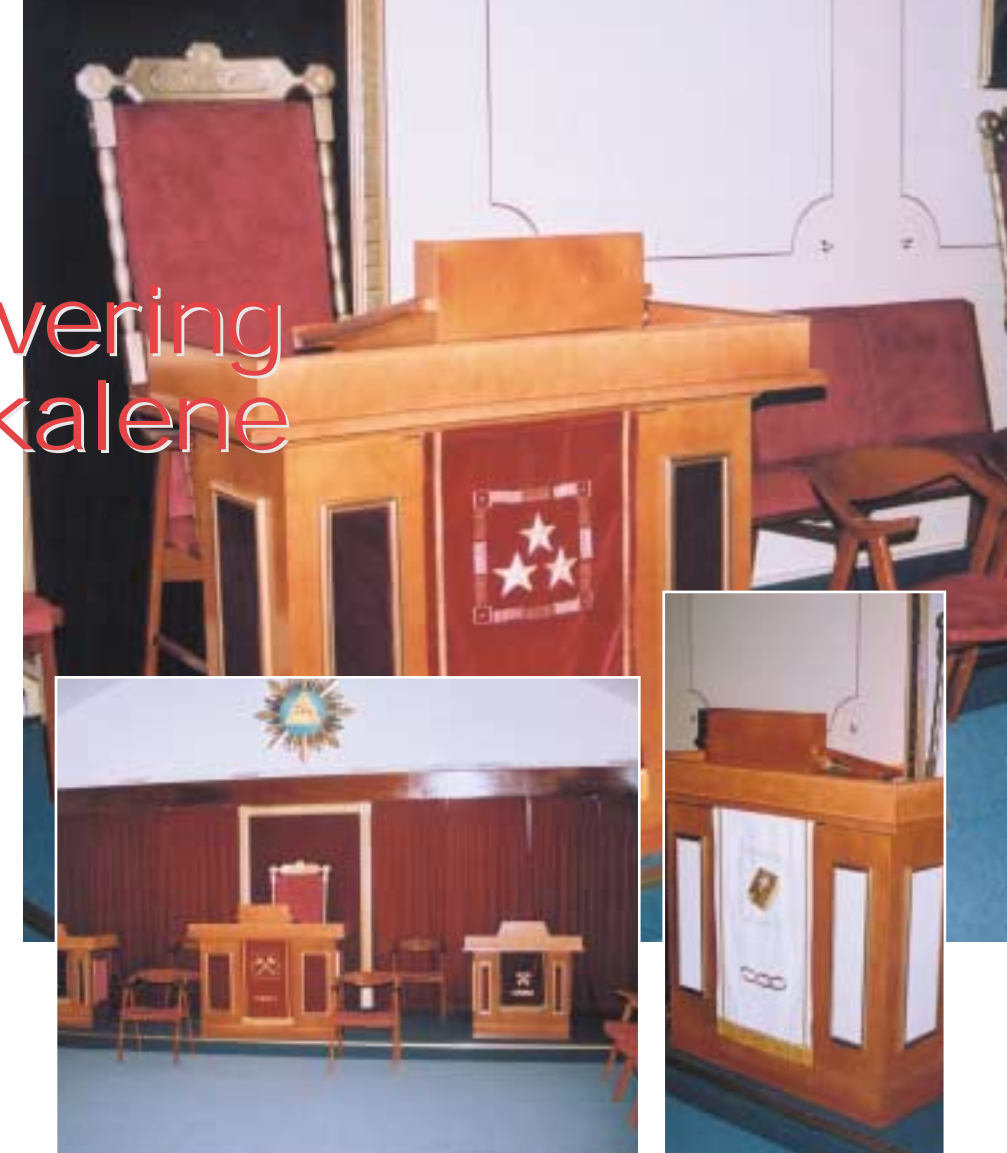
De nye Ordenslokalene i Moss.