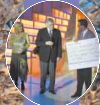
Overrekkelse av Landssaken