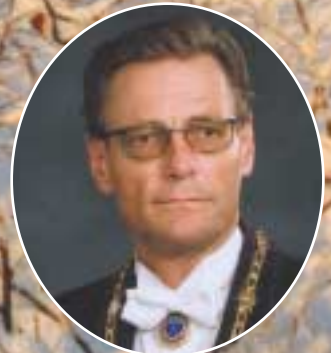
Intervju med Stor Sire