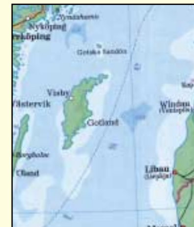
Gotland – øy i Østersjøen mellom Sverige og Litauen. Yndet feriemål for nordmenn i alle aldre.