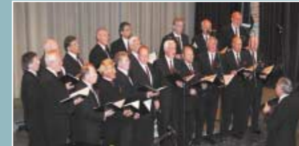
Hans Egede-koret i svingende samsang.