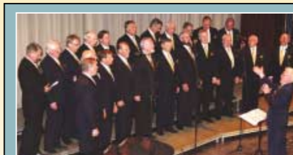
Heidmork-koret fra Hamar i aksjon under festivalen