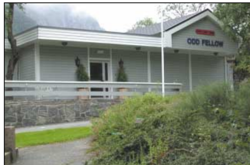
Her er den vakre Ordensbygningen i Odda – et sentrum under 17 mai-feiringen.

Tidlegare selskapslokale, kafe og kiosk, overteke i år 2000 og organisert som andelslag. Pussa opp og den nye logesalen vart teken i bruk første gong til nyttårsloge 2.1.2001. Innvigd 13.10.2001. Ved sida av Loge 49 Hardanger og Loge 55 Margrethe nyttar druideloge Mizar huset som fast møtestad, og huset vert leigd ut som selskapslokale.