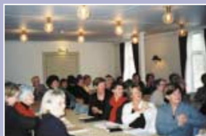
Her er hele plenumet – en svært lydhør forsamling!

Som mange av Rebekkasøstrene husker og da spesielt de som er medlemmer i Rebekkaleirene, så ble Hovedmatriarkmøtene avviklet i 2002. Disse hadde vært avholdt annet hvert år gjennom noen år. Så kom en oppfordring om å avvikle disse møtene. I 2001 ble det derfor sendt ut forespørsel til samtlige Rebekkaleire om det var enighet omkring forslaget. Resultatet var overveiende for avvikling. Noe som formelt skjedde våren 2002.