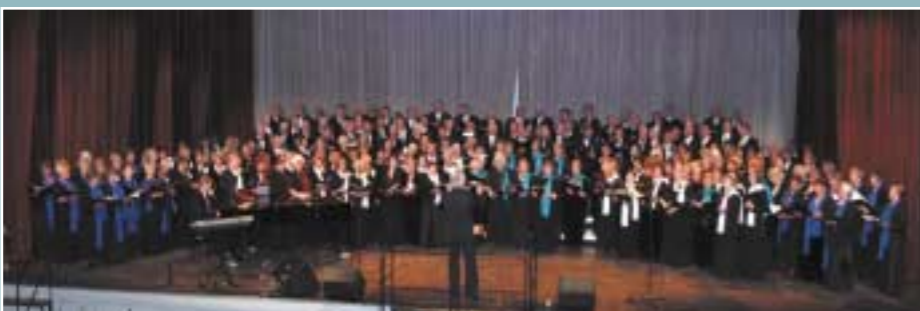
Festivalens store opplevelse sto nok det mektige Felleskoret for. Så mange sangere på en scene var en sjelsettende begivenhet!