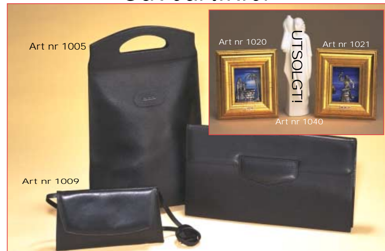
Art nr 1005