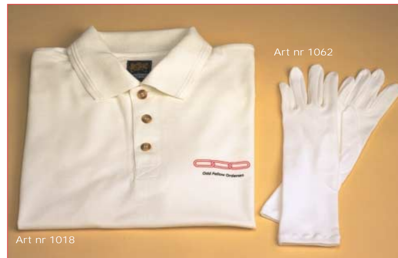
Art nr 1018

Navn: ..... Odd Fellow Utstyr Postadresse: ..... Stortingsgaten 28 Postnr/sted: ..... 0161 OSLO Telefon dagtid: ..... Telefax: 22 83 81 88 E-post: of.utstyr@oddfellow.no