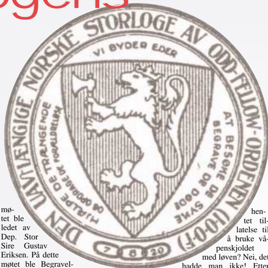
Seglet på denne side: Storlogens segl 1920-1928.

Under arbeidet med å sannere og strukturere gammelt arkivmateriale i egen loge, kom jeg over en gammel blankett. Den er utgitt av Storlogen, kalt Formular XXI og synes å være trykt i mars 1922, i et opplag av hele 20.000!