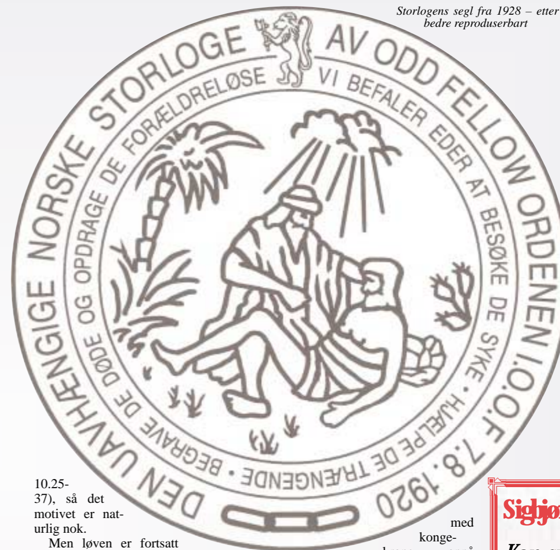
Storlogens segl fra 1928 – etter rentegning i 1996 for å bli bedre reproduserbart

10.25-37), så det motivet er naturlig nok.