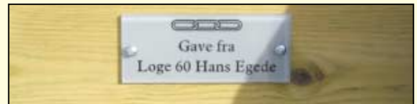
Inskripsjonen på Bjarkøybenken – overlevert 18. juni 2004.

logens medlemmer for på den måten å holde utgiftene på et minimum.