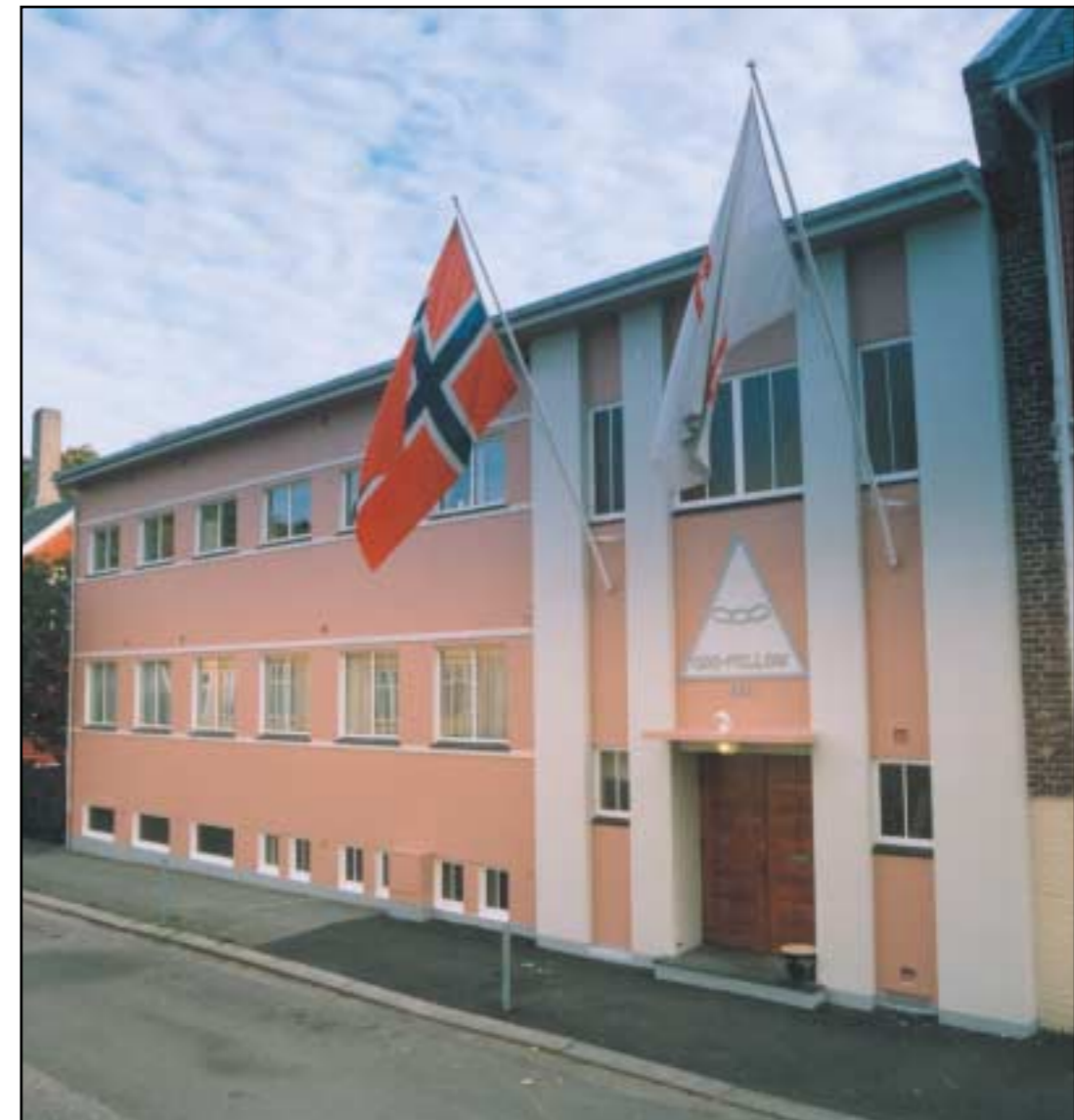
Ordenshuset i Haugesund er blitt et kjent innslag i bybildet. I tillegg til å dekke logenes og leirenes behov både for rituelle rom og selskapslokaler, brukes huset i betydelig grad til høytideligheter som brylluper, konfirmasjoner og begravelser. På denne måten har huset også sin samfunnsmessige funksjon, og representerer en positiv form for synliggjøring av Ordenen i lokalsamfunnet.

Festen var storslått, stemningen høy og huset glødet og bar varmt gjenlyd ut i de små timer. Nå gjenstår arbeidet med å utvikle et nytt «logehjem» hvor den gode broderånd og det indre liv får utvikle seg og blomstre på en flott måte.