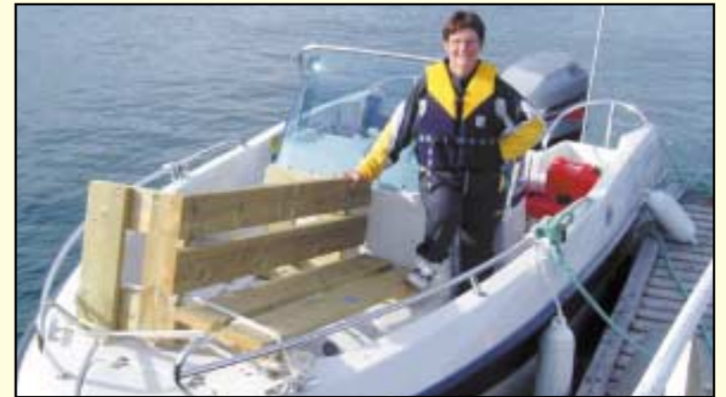
På bildet – levering av benk til Bjarkøy kirkegård – pr båt.

Logen har skaffet midlene til benkene gjennom gaver, utlodninger, tilstelninger og bevilgninger fra egne midler. Transporten av benkene både til lands og til vanns har i stor utstrekning vært utført av