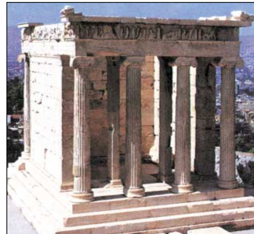
Nike-tempelet i Akropolis, Athen.

Her har det muligens også inngått en type måltider og drikker som skulle virke forberedende.