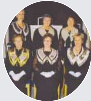
Rebekkaloge nr 119 Mali