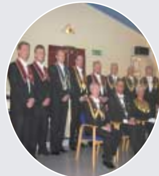
Loge nr 43 Nordlys fyller 50 år