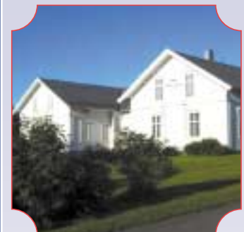
Ordenshuset i Bodø side 11