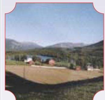
Viken gård i Troms side 14-15