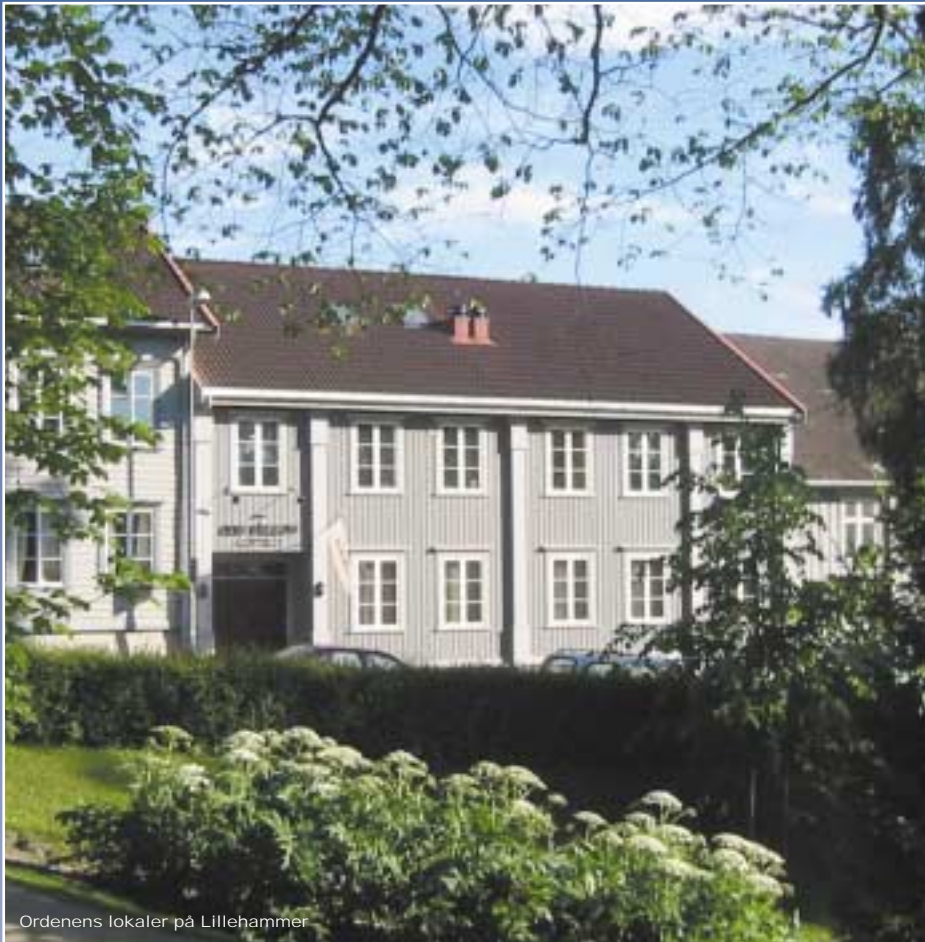
Ordenens lokaler på Lillehammer

Organ for Den Uavhengige Norske Storloge I.O.O.F•84. årgang