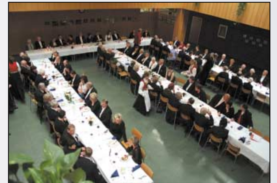
Gallamiddag i aulaen i Odda vidaregåande skule.