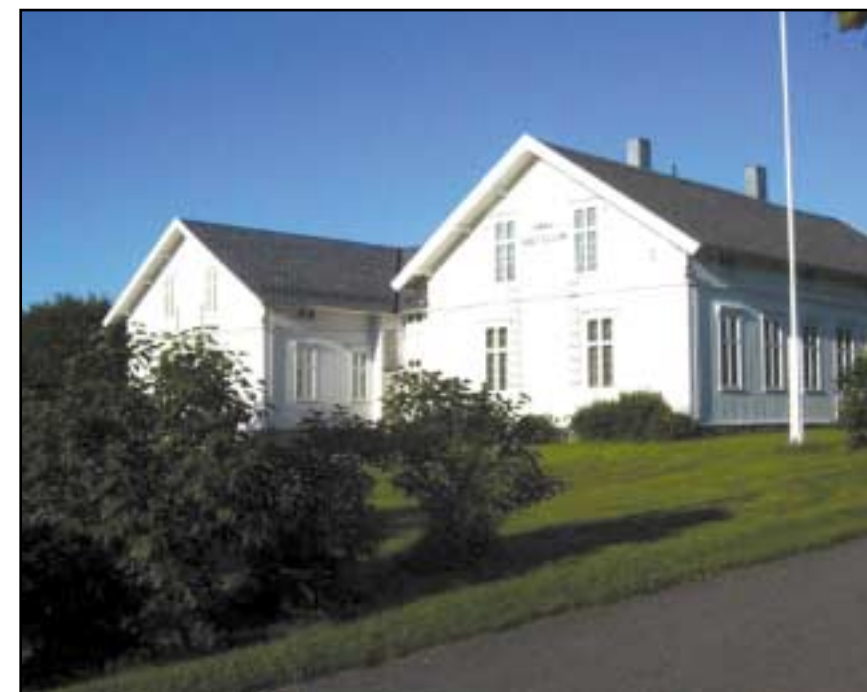
I vakker kveldssol er Odd Fellow Ordenens nye lokaler fotografert. De huser alt fra øvingslokaler for Odd Fellow-koret til saler for loger og leire. En pryde for enhver loge!

gene her har gjennomført, har bare vært mulig med et stort og økende medlemstall som idag tilsvarende omlag 2% av byens befolkning. Og husman-