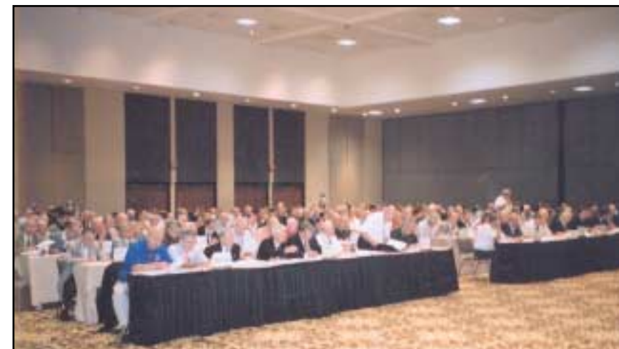
SGL-møtets delegater benket ved langbord etter hvor de kommer fra og hvilken gren de representerer. En del har vært med på SGL-møtet langt tilbake i tid og kan «gamet».

Spenningen var til å ta og føle på da forsamlingen torsdag 24. august 2006 kl 11 skulle votere over forslaget. Forslaget hadde vært til behandling dagen før til samme klokkeslett. Det