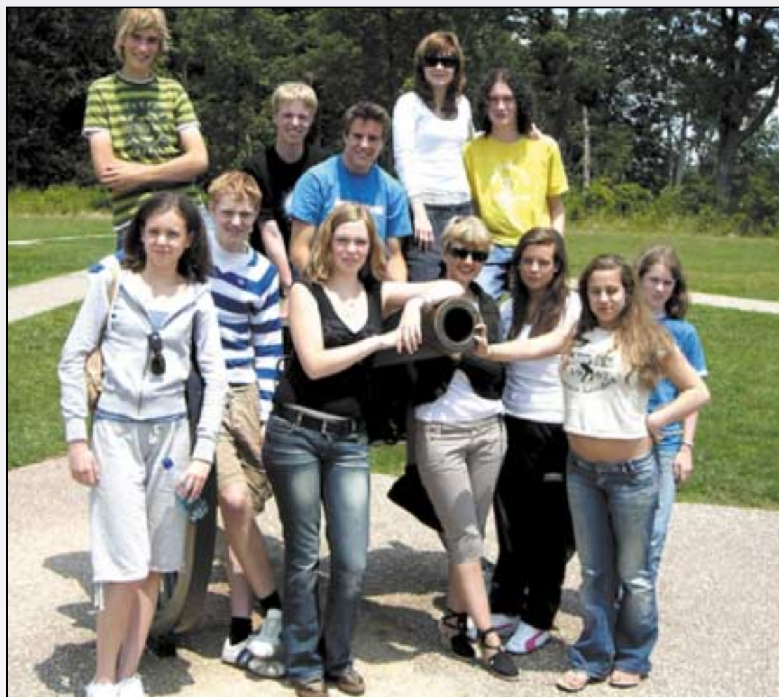
UNP-2006: Den norske delegasjonen med reiseleder i Gettysburg, USA.