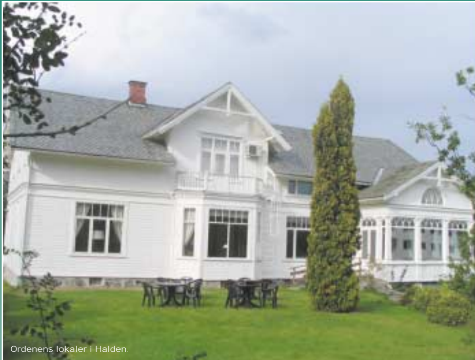
Ordenens lokaler i Halden.

Organ for Den Uavhengige Norske Storloge I.O.O.F. 84. årgang