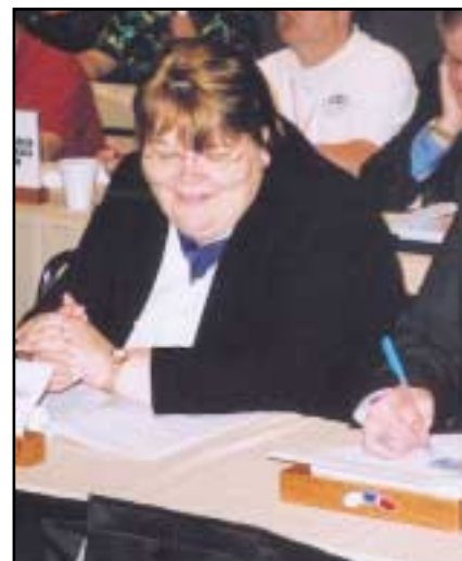
Manchester Unitys representant i møtet.

Ut fra disse forholdene dannet SGL et International Council i 1949, like et-