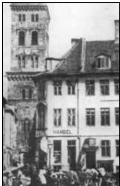
Lille Kirkestræde 5 i København hvor den første Odd Fellow forening ble stiftet 12. februar 1878.

Mens hele det nordamerikanske kontinent i sin helhet ble underlagt Odd Fellow Ordenen i løpet av en femtiårsperiode, skulle det gå ganske anderledes i Europa.