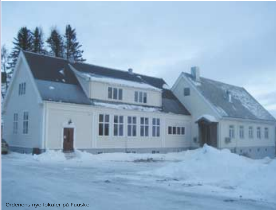
Ordenens nye lokaler på Fauske.

Odd Fellow Ordenens Magasin • 85. årgang