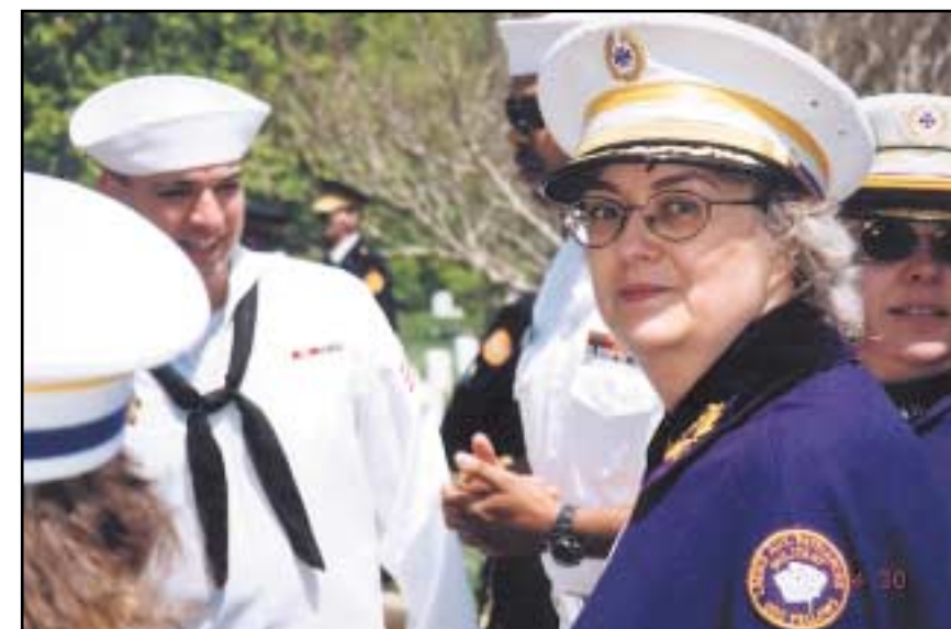
Patriarchs Militant stiller opp for å defilere på Arlington i mai 2005.

versell rettferdighet.» Medlemmene mener seg å være voktere og beskyttere av vår Orden og dens idealer gjennom mottoet: Vokte om vårt edleste klenodie; Vennskap. Vokte om vårt skjønneste klenodie; Kjærlighet. Vokte om vårt dyreste klenodie; Sannhet. Når man har vært Chevalier i et år, kan en få tildelt en Ridderjuvel. Dette er en juvel vi altså kan treffe på og får se hos våre dansk Ordensbrødre.