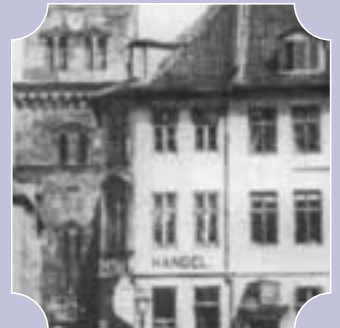
I.O.O.F. i Danmark