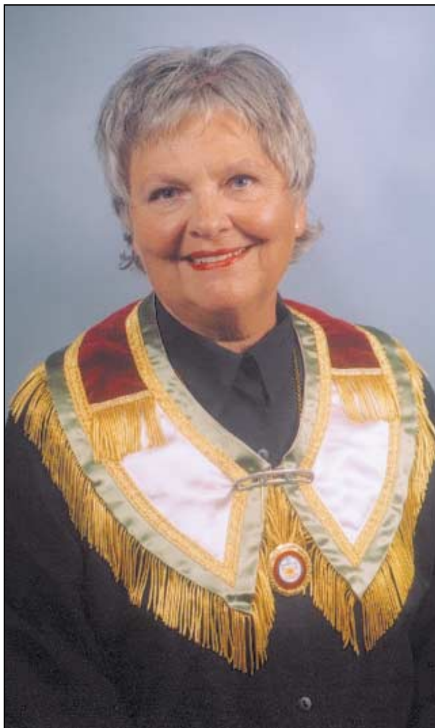
Odd Fellow Ordenens Magasin

kelpersoner har rast på det verste, har det ført til store diskusjoner på vår balkong. En forvillet, men vakker fredsdue ble vettskremt da heftige armbevegelser traff den midt i brystet under en av våre diskusjoner om kjøp av hovedstadsaviser i det hele tatt skulle fortsette å inngå i feriebudsjettet. Vi spurte oss om "ærlighet varer lengst" når media stadig kom med "sannheter" rundt en svært betent sak. Vi lurte på hvor vennligheten, kjærligheten og viljen til løsning lå hos de impliserte parter, og om media rett og slett heller "bensin på bålet" i stedet for "olje på vannet". Diskusjonene våre ble også i overkant opphetet sett i relasjon til våre ulike erfaringer gjennom to lange liv. Både fra våre arbeidsliv, fra arbeid i frivillige organisasjoner og for mitt vedkommende fra et langt Ordensliv.