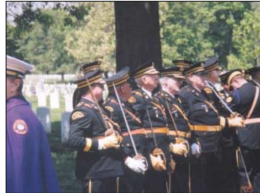
Matriarchs Militants i samtale med en marinesoldat ved Arlington.

øverste leder. Lederen av en Canton tituleres Kaptein. Medlemmene kalles Chevaliers. Det betyr Ridder, og oversettes i Danmark til Rettferdig Soldat. Uniformen med korde utgjør medlemmenes regalie. Uniformen er et av de mange klenodiene vi har utstilt i Odd Fellow Ordenens Museum i Oslo.